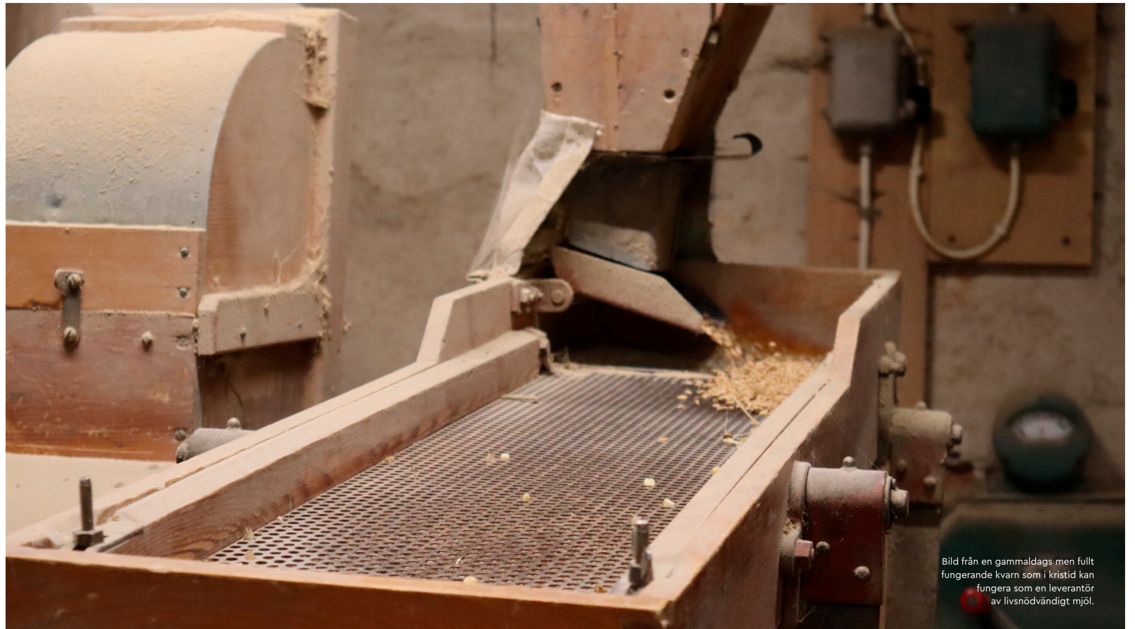
Bild från en gammaldags men fullt fungerande kvarn som i kristid kan fungera som en leverantör av livsnödändigt mjöl.

Genom att satsa på lokala initiativ kan vi öka vår motståndskraft och höja självförsörjningsgraden. Men kan enbart lokala projekt bära hela lösningen? Låt oss se hur nära svaret egentligen kan ligga.