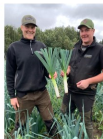
Br. Schwartz Lantbruk

Tranberga Södergården 120, 591 94 Motala