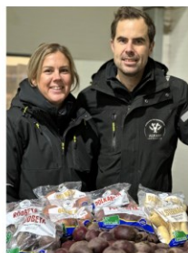
Alkarp Lantbruks AB

Vi odlar: Slanggurka, Västeråsgurka, Vit smågurka och Tomater